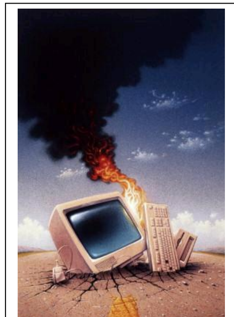
Un virus puede hacer que su Computadora se vuelva Completamente inservible. Conozca cómo protegerla.

La mejor manera de protegerse frente a los virus es mediante la utilización de un programa antivirus y solo ejecutando programas de origen conocido. Una práctica común es engañar a los usuarios a ejecutar un programa infectado renombrándolo como si este fuese un protector de pantalla o documento de Office.